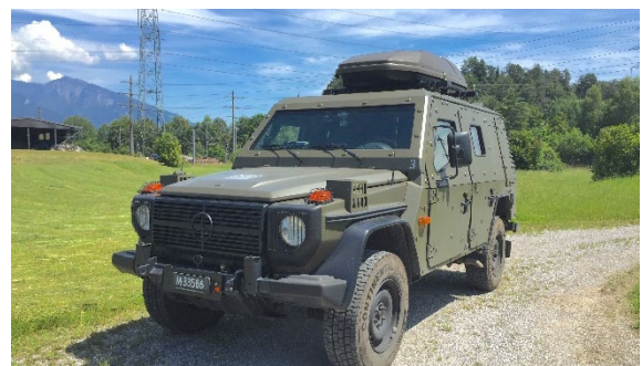
Figure 3 Véhicule de radiométrie