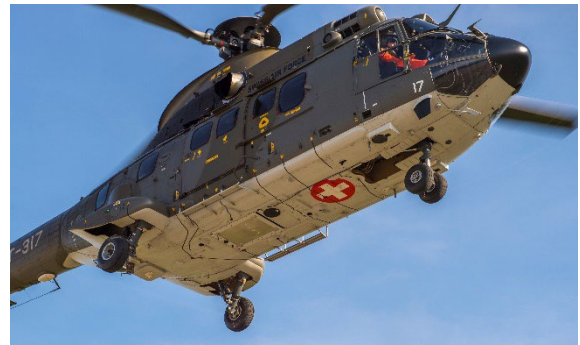
Figure 1 Super Puma des forces aériennes

En quelques heures, un équipement de radiométrie ultrasensible est installé à bord d'un hélicoptère Super Puma des forces aériennes. Afin de cartographier le territoire de manière aussi complète que possible, l'hélicoptère survole le secteur considéré à environ 90 mètres d'altitude en suivant des lignes parallèles, généralement espacées de 250 mètres.