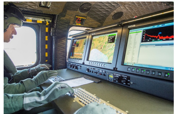
Figure 2 Place de travail des opérateurs

L'orientation omnidirectionnelle des détecteurs permet une localisation précise des éventuelles sources radioactives. La pressurisation de la cabine et la filtration de l'air assure la protection de l'équipage en zone contaminée.