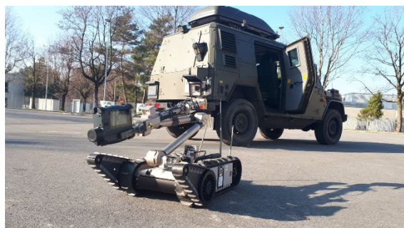
Figure 4 Robot d'exploration équipé d'un appareil de radiométrie portable

À cet effet, les spécialistes disposent d'appareils qui peuvent être utilisés en sac à dos, à la main ou installés sur le robot.