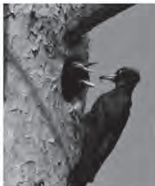
Pic noir

Le maintien de ces éléments implique une approche esthétique différente de la forêt. L'image du « propre en ordre » très présente jusqu'à la fin du siècle passé disparaît petit à petit. En effet, pour ses besoins énergétiques notamment, l'homme exploita souvent pratiquement jusqu'à la dernière brindille. Même litière et glands étaient récoltés favorisant ainsi une image de jardin forestier.