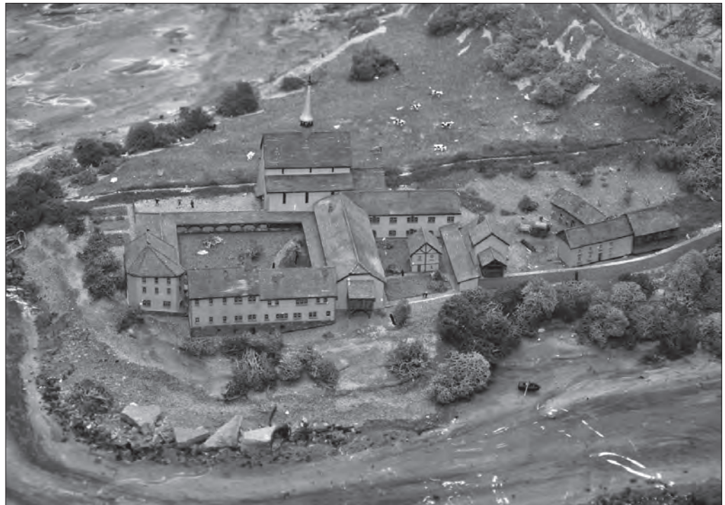
Elément de la maquette FRIMA