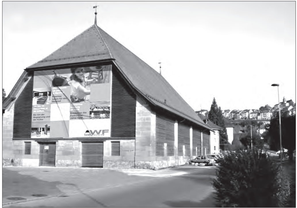
Le Werkhof à Fribourg