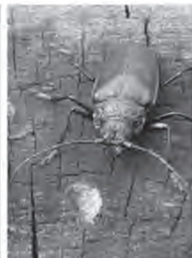
Longicorne : Ergate forgeron

Les tas de branches laissés en forêt après une exploitation suivent cette même logique de la promotion d'habitats forestiers. Contrairement à certaines croyances bien ancrées, ces restes de coupe ne véhiculent en aucun cas des maladies et ne contribuent pas au développement du bostryche 2 .